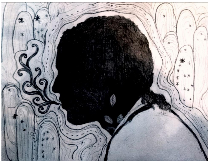
“Los chakaruna vinculan ambos mundos y los protegen del abuso posible entre ellos”

feroz y letal. Se requiere salir de la objetividad racionalista cerrada occidental, unir el hemisferio izquierdo y el derecho del cerebro, unir los pueblos tradicionales y occidentales o sus pensamientos. Fecundarse recíprocamente sino ambos morirán. Es una necesidad vital y recíproca. ¿Y quién va a hacer eso? Los chakarunas, personas que pueden tener un vínculo con ambos hemisferios, que son simbólicamente las personas que tienen un pie en un mundo y en otro, sirven de intérpretes, de traductores, vinculan ambos mundos y los protegen del abuso posible entre ellos. Deben conocer algo de la racionalidad científica para alertar a los indígenas para que no se dejen engañar y fascinar por el mundo occidental y sus sombras. Igualmente deberán alertar a los occidentales sobre los peligros de las sombras del mundo indígena y las prácticas de brujería o manipulación subliminal que puedan dar pie a contaminaciones espirituales. Ambos mundos tienen sus sombras, no hay uno que sea mejor que el otro, tienen funciones diferentes y complementarias. Si juntan lo mejor de cada uno y asocian sus valores, su fuerza, sus conocimientos, la vida rebrotará hacia la libertad. Hace 500 años hubo un desencuentro considerable entre las tradiciones occidental e indígena, pero ha venido el momento de un posible encuentro real, auténtico, fecundador, además de vital, y este será espiritual o no será.