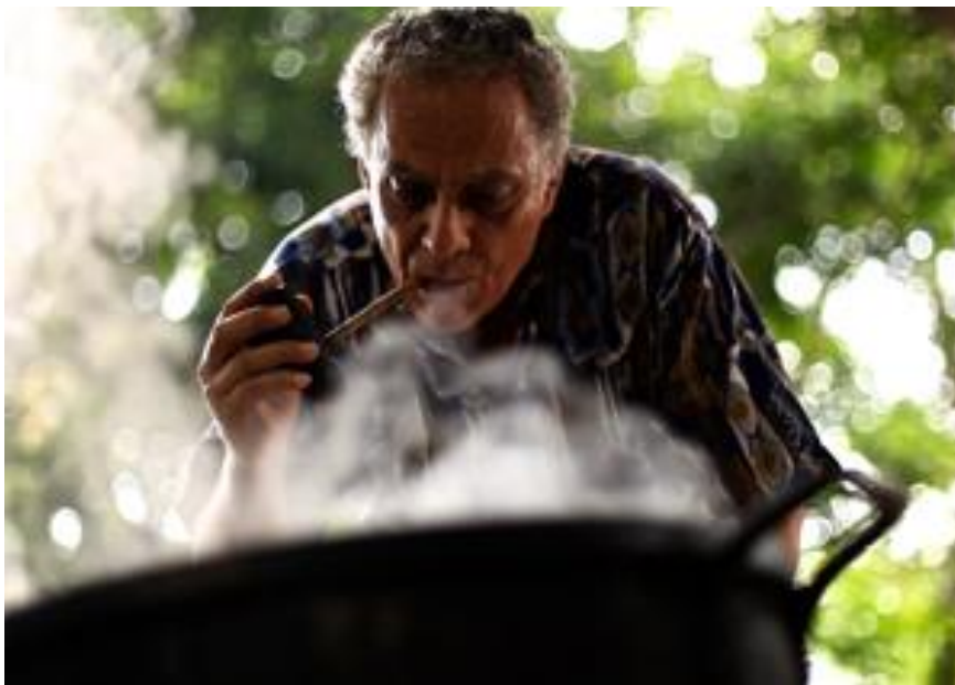
En la preparación de ayahuasca

no pasa por los libros, es una comprensión que no es intelectual, conceptual, sino a partir del cuerpo, de la vivencia propia, sino quedará como una elaboración mental más o menos sofisticada. Más y más científicos de alto nivel se atreven a reclamar este cambio de paradigma como los que suscribieron al Manifiesto para una Ciencia Post-Materialista (ver http://opensciences.org/ ).